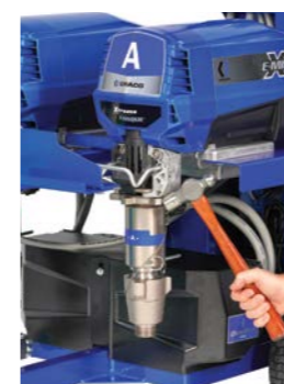
1. Allentare il dado di blocco