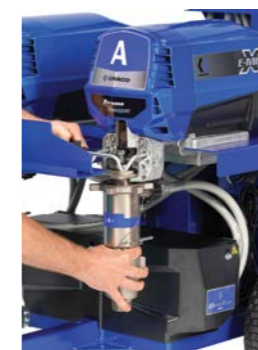
2. Aprire lo sportello e rimuovere la pompa