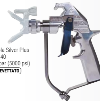
Pistola Silver Plus 246240 345 bar (5000 psi) BREVETTATO

DURATA FINO A 2 VOLTE SUPERIORE FRA UNA SOSTITUZIONE DI GUARNIZIONI E L'ALTRA