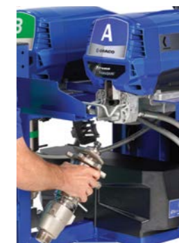
3. Rimuovere il tubo flessibile e far scorrere la pompa fuori