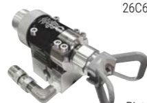
Pistola AL-7 26C625