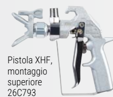
Pistola XHF, montaggio superiore 26C793