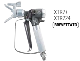
XTR7+ XTR724 BREVETTATO