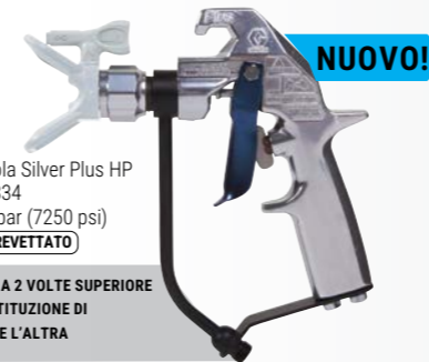
Pistola Silver Plus HP 273334 500 bar (7250 psi) BREVETTATO

Pistola di preferenza di molti appaltatori, la pistola Silver Plus di Graco è nota per la sua resistenza, la lunga durata, le prestazioni spruzzatura e il design confortevole.