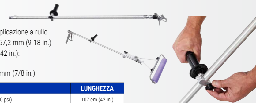
Impugnatura completamente regolabile per il massimo comfort