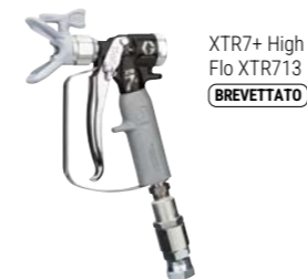
XTR7+ High Flo XTR713 BREVETTATO