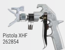
Pistola XHF 262854

La pistola XHF è la scelta ideale per i rivestimenti più pesanti e i materiali fibrosi. Queste pistole presentano passaggi del fluido sovradimensionati e un design senza filtro per offrire una portata massima e un'atomizzazione superiore.