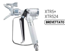
XTR5+ XTR524 BREVETTATO