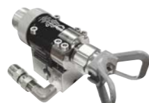
Pistola AL-5 26C624