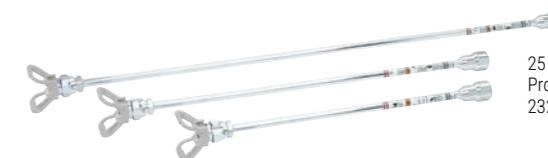
25 cm (10 in.) Prolunga per usi gravosi 232121